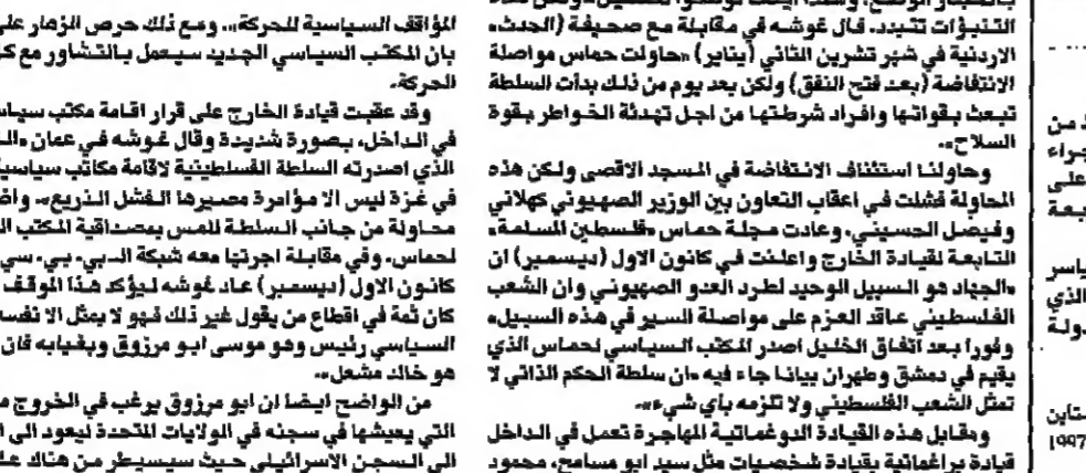
موسى أبو مزلوك

طوال السنوات التسع الماضية لم تعرف حركة حماس مثل هذا التفكك الذي تعاني منه هذه الايام. وهذا الوضع انعكس على القيادة اللوزية بين المناطق في عمان ودمشق وطهران ويروشك ان يولي الشق صوفيا، فالمرامات المتباينة تفتل نشأة الحركة الفلسطينية والمصرية.